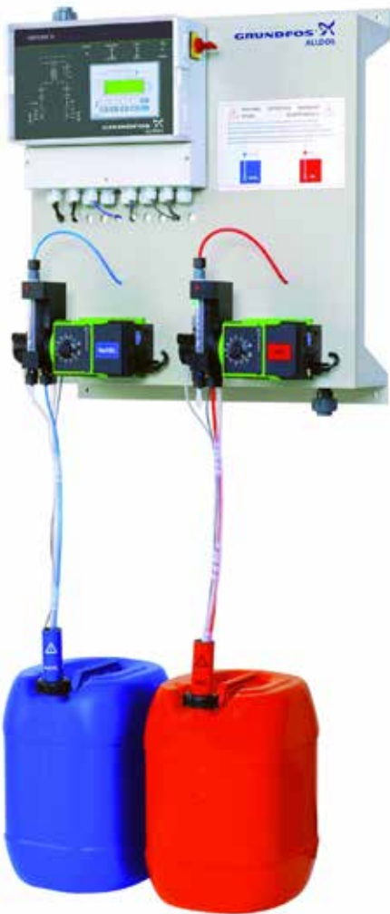
OXIPERM OCD-164 i OCC-164

Els generadors via clor gas empen \text{NaClO}_2 al 25% i clor gas. Aquests equips ofereixen un elevat rendiment de generació i són perfectes per a la seva integració en instal·lacions existents de clor gas.