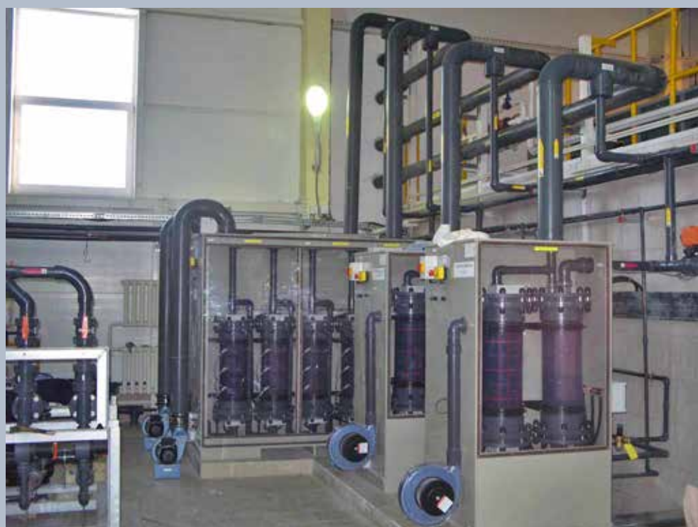
Instal·lació d'electrocloració Selcoperm fins a 900 kg/dia