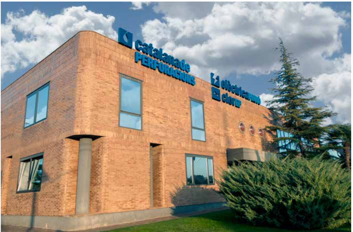
Seu del grup AQUACENTER a Santpedor (Barcelona)

Les sinergies produïdes per la unió col·laborativa entre les diferents empreses del grup, ens permeten el desenvolupament i subministre de noves solucions eficients i respectuoses amb el medi ambient.