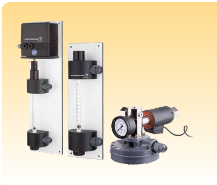
VACCUPERM VGA-117 & VGA-146

Han estat dissenyats per un funcionament completament automatitzat, per instal·lacions murals o de cabina, i amb unes capacitats de dosificació regulables i precises de fins a 200 kg/h mitjançant una sola unitat de dosificació.