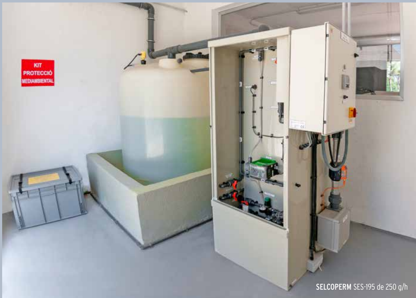
SELCOPERM SES-195 de 250 g/h